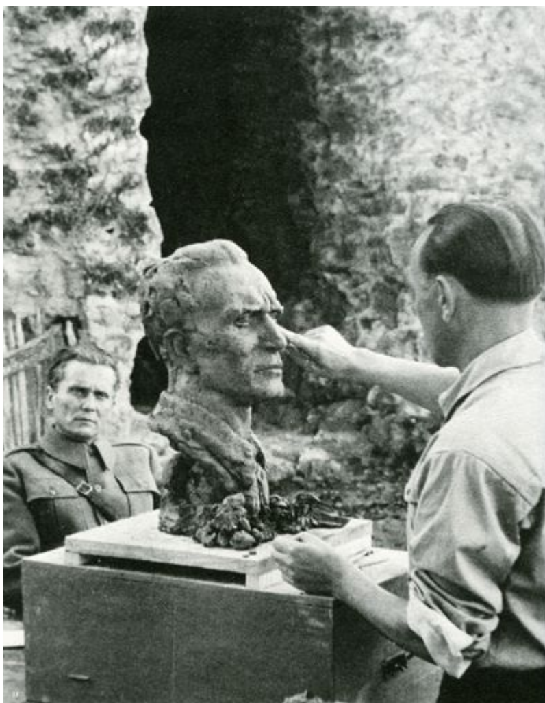
Antun Augustinčić portretiše Tita u Jajcu 1943.

(Beograd, 1949). Međutim, obe biste, Augustinčićeva (koja je protumačena kao „početak izgradnje kulta“) i Dejvidsonova, bile su prirodnih razmera i nisu bile namenjene kultu i memorijalizaciji, odnosno trajnom izlaganju u javnom prostoru. Istoričarka Olga Manojlović Pintar iznosi mišljenje da je postavljanje Titove biste na Drugom zasedanju AVNOJ-a „imalo funkciju da vizuelizuje odluku AVNOJ-a o zabrani povratka u zemlju kralja Petra II i jasno istakne ličnost Josipa Broza Tita kao prvog predsednika Jugoslavije“, a ujedno i „afirmaciju celokupnog partizanskog pokreta“. „U toku pet dana, koliko je trajao Augustinčićev rad na toj bisti 'dolazili su Skrigin i Maklin (koji su) poslali te fotografije u svet da dokažu da se u šumi ne vodi samo borba, nego da se tu i kulturno živi’.“ 133