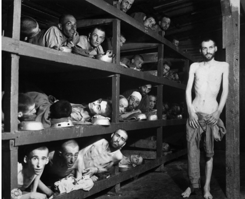
Poznata fotografija iz logora Buhenvald koja je zloupotrebljena na izložbi.

Ovo nije jedini primer manipulisanja prepoznatljivim simbolima fašističkog terora, u postavci. Odmah pokraj fotografije iz Buhenvalda, izložena je predratna fotografija centralne građevine nekadašnjeg Beogradskog sajmišta, odnosno fotografija objekta u kome je tokom nemačke okupacije bila smeštena uprava logorâ Judenlager Semlin (Jevrejski logor Zemun, 1941-1942) i Anhalterlager Semlin (Prihvatni logor Zemun, 1942-1944). Ovu fotografiju prati sledeći tekst: „Padobranski toranj postaje mitraljesko gnezdo, period 1952-1953. Žitari, informbirovc i neprijatelji svih boja tako su čuvani na Sajmištu.“