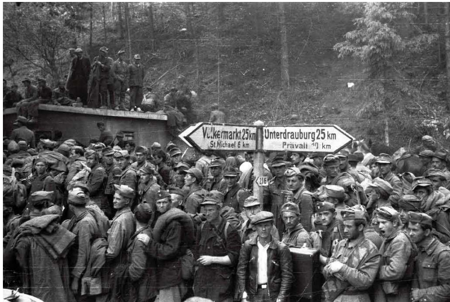
Pripadnici Oružanih snaga NDH (ustaše i domobrani) na Blajburškom polju. Neadekvatna ilustracija na temu političke represije u Srbiji 1944-1953.

Međutim, suštinski prigovor u tumačenju ove fotografije tiče se činjenice da se ova fotografija u referentnoj literaturi tumači kao „izbjeglička kolona pred Blajburškim poljem“, dakle kao grupa pripadnika Oružanih snaga NDH u bekstvu, a ne kao grupa ratnih zarobljenika. 124 Nije poznato ko je od lica prisutnih na fotografiji kasnije bio zarobljen i iskusio tzv. „Križni put“. Isticanjem na ovoj izložbi vrši se viktimizacija pripadnika Oružanih snaga NDH.