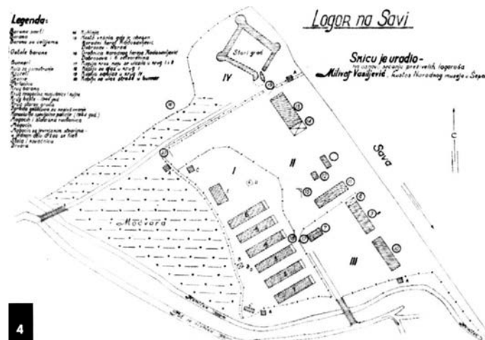
Mapa nemačkog logora u Šapcu.

Tokom 1944. uhapšen je velik broj pripadnika i pristalica NOP-a u Mačvi i Podrinju, od strane kvislinških organa, koji su potom zatočeni u Logoru na Savi. Specijalna policija i policajci iz Predstavništva gradske policije u Šapcu vršili su isleđivanja i mučenja zatočenih pripadnika NOP-a u Logoru na Savi, 1942. i 1944. 128