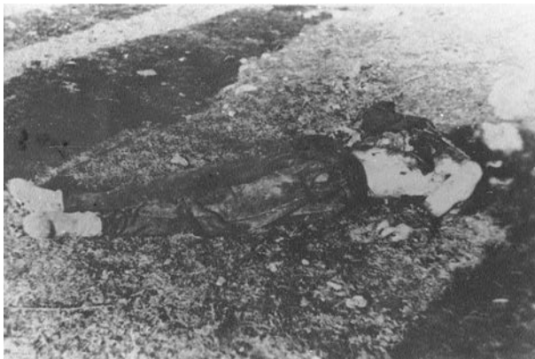
Navodna fotografija streljanog Draže Mihailovića.

Ova fotografija je prvi put prezentovana domaćoj javnosti 1990-ih i vešto je iskorišćena od strane antikomunističkih propagandista kao navodni dokaz bestijalnog odnosa prema Mihailoviću (na slici se nejasno nazire da je ubijenom muškarcu odsečena leva ruka u visini lakta). Prikazivanje ove fotografije, preuzete sa interneta, dodatno problematizuje „isecanje“ dela glave muškarca na slici, usled čega je nemoguće uporediti ovu reprodukciju sa autentičnim Mihailovićevim foto-portretima, pri čemu se ne želim upuštati u špekulacije da li je „kropiranje“ ove sporne fotografije rezultat omaške u pripremi za štampu ili nečije namere.