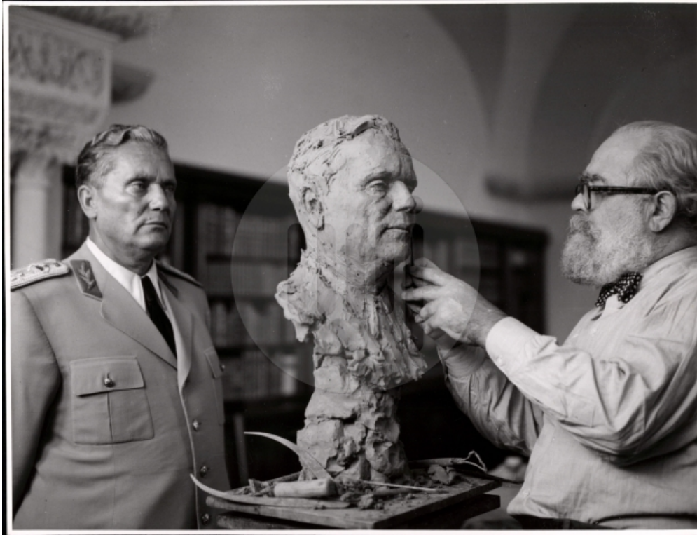
Američki vajar Džo Dejvidson portretiše Tita u Beogradu, 1949 (izvor: Muzej istorije Jugoslavije).

Na sličan način, kao manifestovanje Titovog kulta, autor je vizuelno, tendencioznom korišćenjem propagandnog materijala iz epohe, veštački povezao delatnost Antifašističkog pokreta žena, Omladinskih radnih brigada i samoupravnih kolektiva u jugoslovenskoj privredi sa tematikom posleratne političke represije, iako je očigledno da rodna i socijalna emancipacija predstavljaju nesumnjiv legat jugoslovenskog socijalizma i da su ključni uspesi emancipacije beleženi upravo u razdoblju koji vremenski tematizuje izložba.