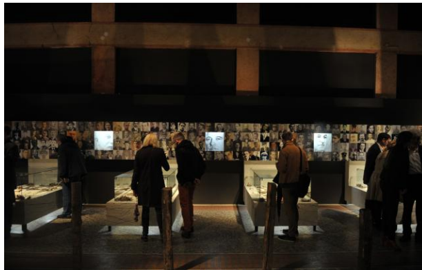
Centralna sala izložbe.