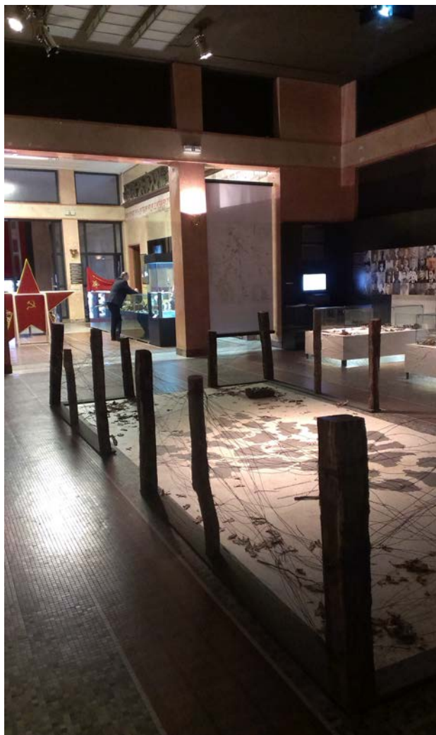
Centralna sala izložbe.

Temi „Likvidacija 'narodnih neprijatelja' 1944-1945“ posvećen je centralni deo izložbe, a ujedno i najobimniji deo kataloga (50 od 160 stranica), koji ima 5 poglavlja, pri čemu je navedena tema obrađena u prvom poglavlju. Prostorom i obimom koji su posvećeni ovoj temi stavlja se do znanja da se stradanje saradnika okupatora percipira kao paradigma zločina oslobodilaca . U tekstu koji prati ovaj deo izložbe sugerise se da su osobe koje su stradale kao narodni neprijatelji bile izložene pogibelji kao „politički i klasni protivnici revolucije“, a ne primarno zbog njihovog angažmana tokom okupacije: