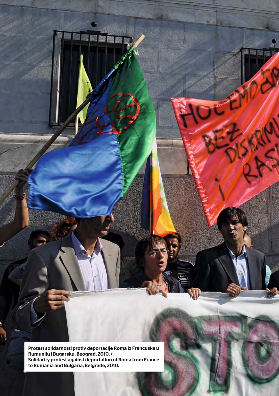
Protest solidarnosti protiv deportacije Roma iz Francuske u Rumuniju i Bugarsku, Beograd, 2010. / Solidarity protest against deportation of Roma from France to Rumania and Bulgaria, Belgrade, 2010.