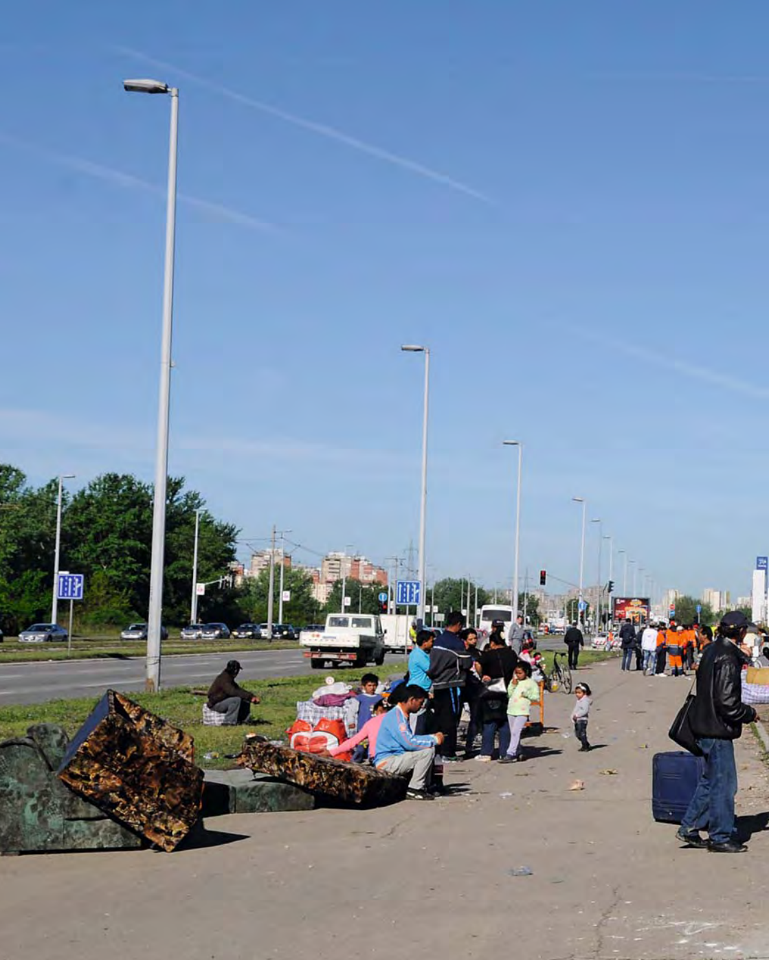
Raseljavanje romskog naselja kod Belvila od strane gradske vlasti, Beograd, april 2012. / Eviction of the Roma settlement at Belville, Belgrade, April, 2012.