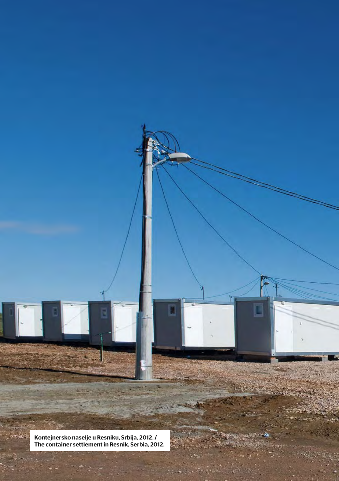
Kontejnersko naselje u Resniku, Srbija, 2012. / The container settlement in Resnik, Serbia, 2012.