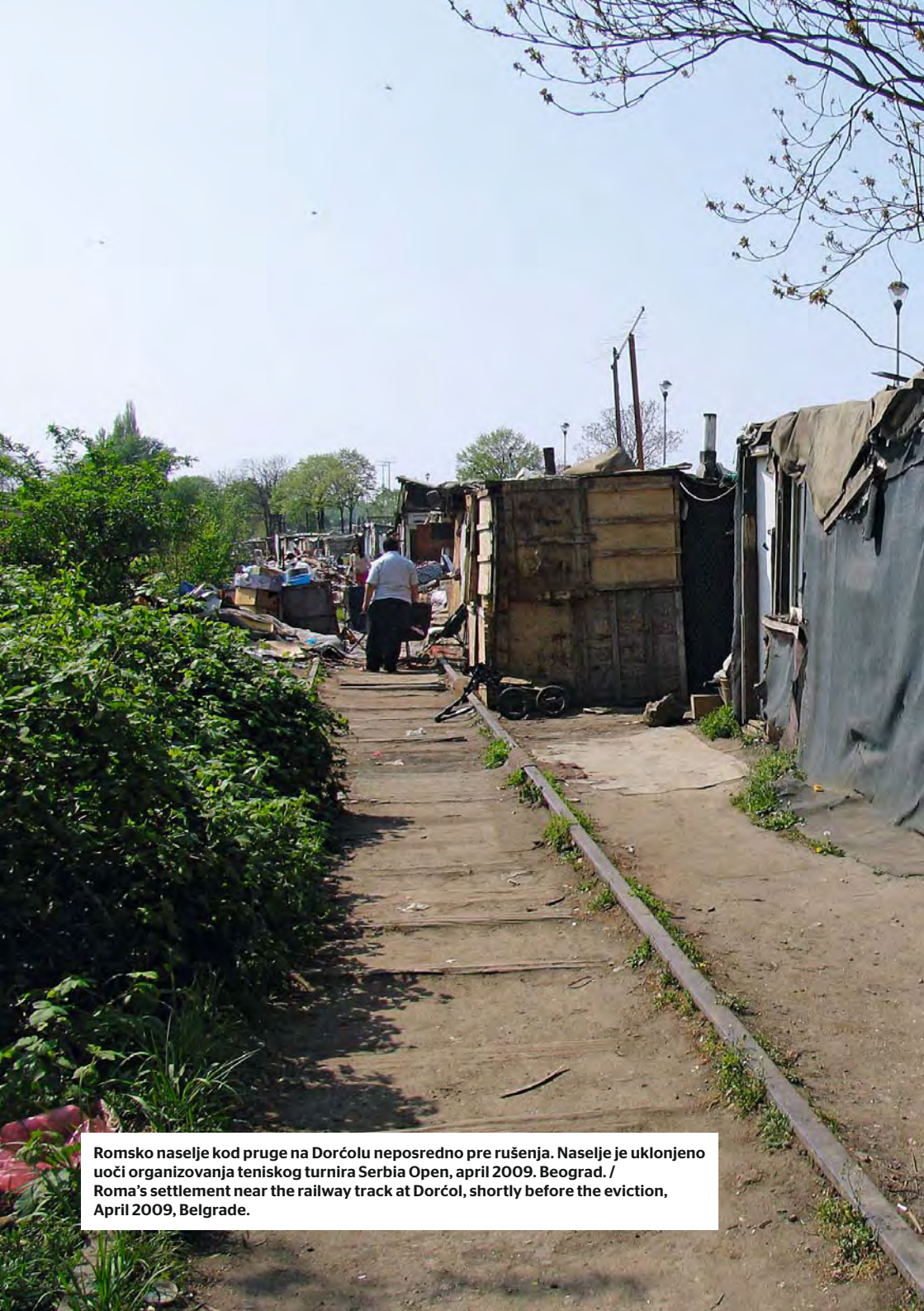
Romsko naselje kod pruge na Dorćolu neposredno pre rušenja. Naselje je uklonjeno uoči organizovanja teniskog turnira Serbia Open, april 2009. Beograd. / Roma's settlement near the railway track at Dorćol, shortly before the eviction, April 2009, Belgrade.