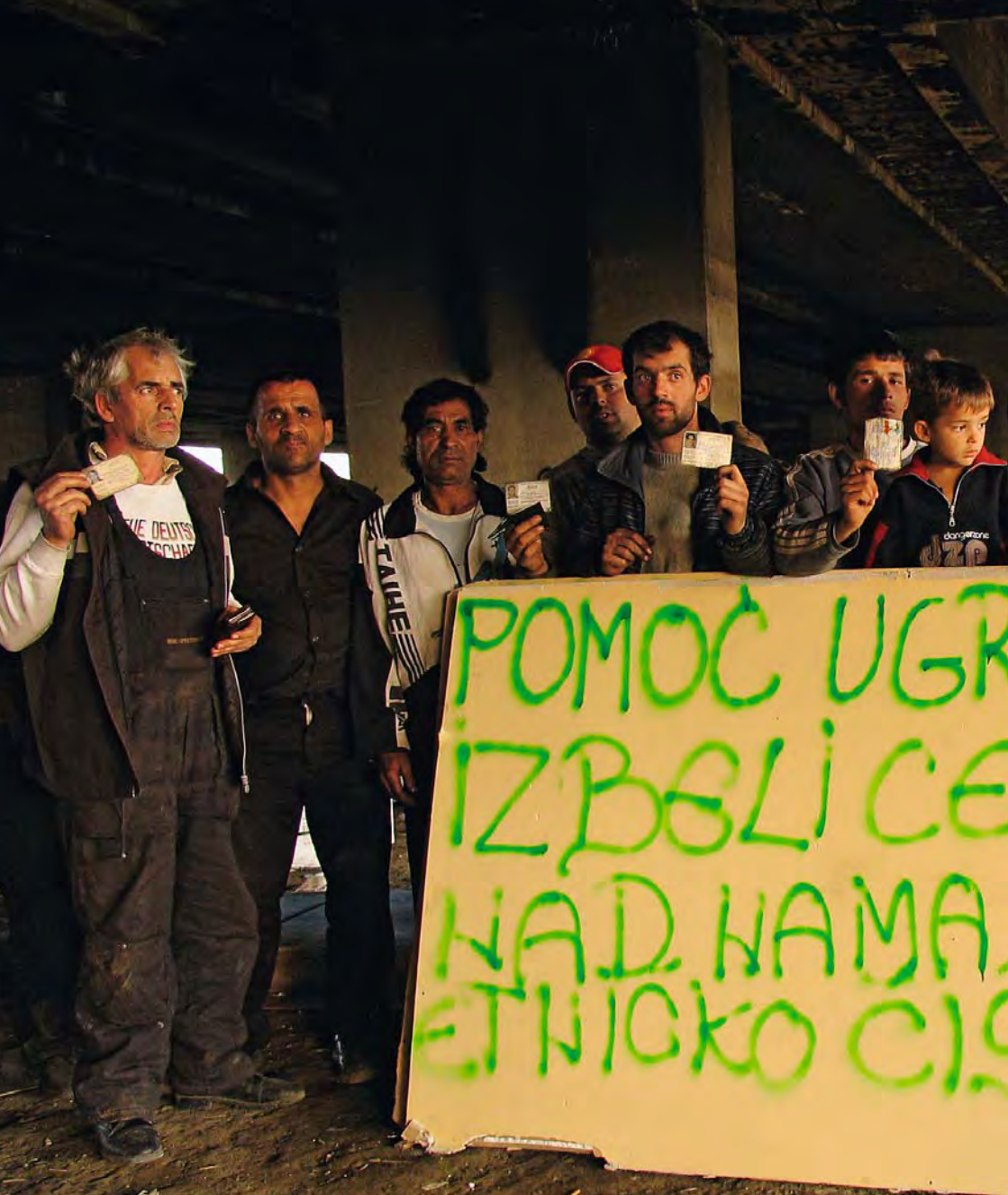
Protest zbog rušenja romskog naselja kod Belvila, april 2009, Beograd. / Protest against the eviction of the Roma settlement at Belville, April 2009, Belgrade. (Inscription on the banner: "Help, we are in danger, we are refugees from Kosovo, victims of ethnic cleansing.")